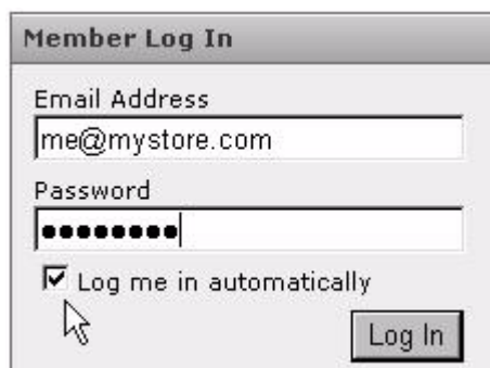
FIGURA 2.1 Accesso alla Centrale sviluppatori di PayPal

NOTA: Per accedere direttamente al servizio Sandbox, è necessario attivare i cookie nel browser in uso.