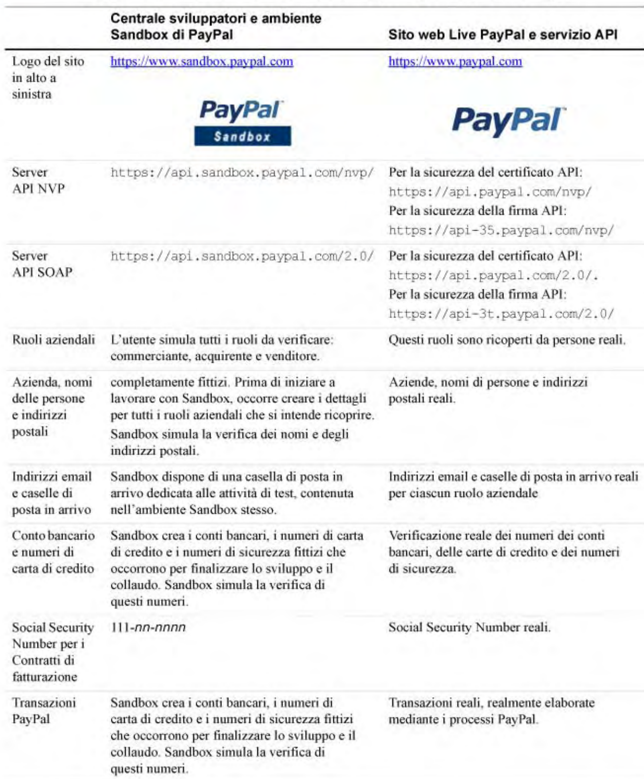
TABELLA 1.1 Differenze tra la Centrale sviluppatori, Sandbox e Live PayPal

Panoramica: differenze tra Sandbox e Live PayPal