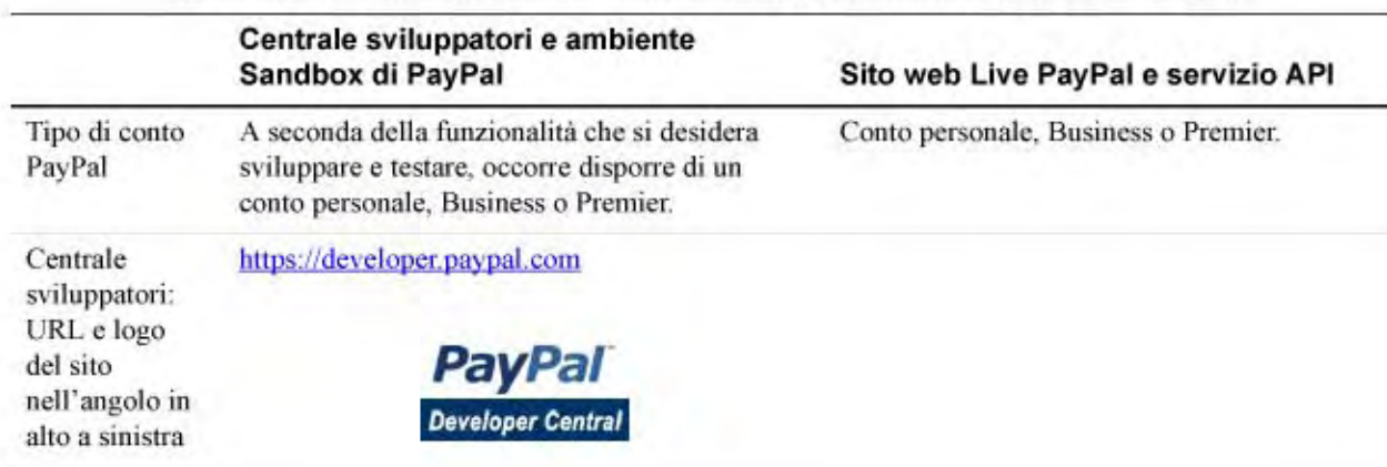
TABELLA 1.1 Differenze tra la Centrale sviluppatori, Sandbox e Live PayPal

La tabella seguente confronta gli ambienti Sandbox e Live PayPal. Si tratta di una panoramica delle differenze dalla prospettiva di uno sviluppatore interno all'azienda o di un fornitore terzo. Questa tabella può essere utilizzata anche come lista di controllo.